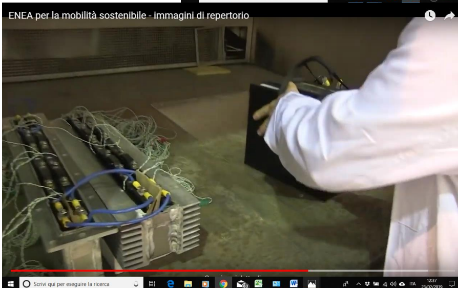
Figura 3: Fotogrammi del video divulgativo, diffuso anche su YouTube