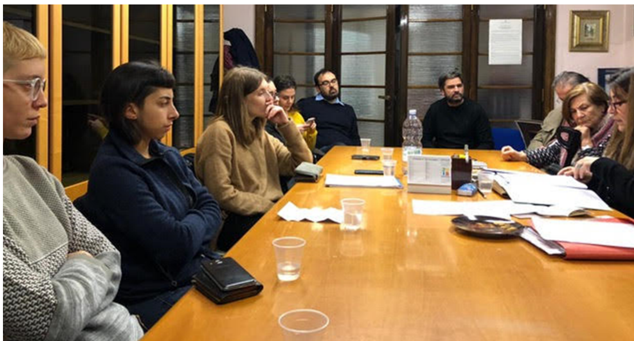
Figura 7. Costituzione formale dal notaio di CooperACTiva