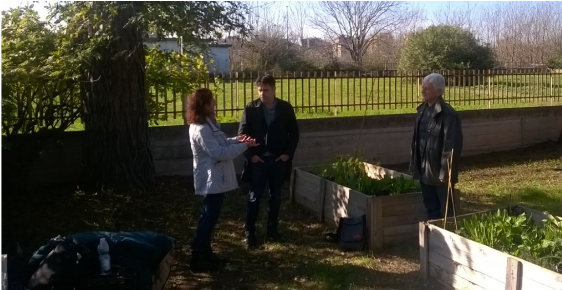
Figura 3. Spotlight Visit Consiglio d'Europa nel co-distretto Alessandrino-Centocelle-Torre Spaccata (orto di comunità nell'area verde adottata dalla CPPC)

La visita si è conclusa con un feedback positivo rispetto all'ingresso della Comunità nel FARO Convention Network e il suo riconoscimento come Faro Heritage Community. I rappresentanti del Faro Convention Network sono rimasti infatti positivamente impressionati dal lavoro realizzato, in particolare dalla rete robusta di stakeholder di quartiere e a livello di città che è stata costruita nel corso degli anni, a livello sia istituzionale, civico, privato, cognitivo definendo la rete stessa una vera e propria risorsa. È stato molto apprezzato il lavoro svolto dall'Università LUISS, in particolar modo l'approccio cooperativo da essa adottato. Hanno messo in luce come la teoria abbia un vero e forte risvolto pratico. Si sono inoltre offerti di contribuire attraverso la costruzione di una narrazione capace di far emergere le tante storie di cui si compone il progetto. A loro avviso, infatti, il pezzo mancante è la narrazione, non intesa come uno storytelling. È importante mantenere la flessibilità e creatività caratterizzanti il progetto. Infine, hanno consigliato di mappare i bisogni di tutto il flusso di gente che il territorio ospita perché possono rivelarsi un ottimo bacino d'utenza.