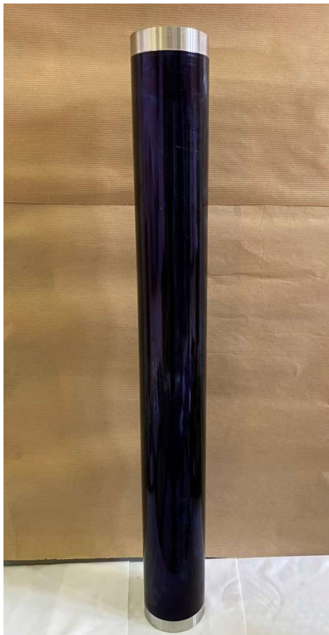
Figura 2. Immagine del prototipo di coating realizzato per operare in vuoto alla temperatura di 550 °C, depositato su tubo di acciaio