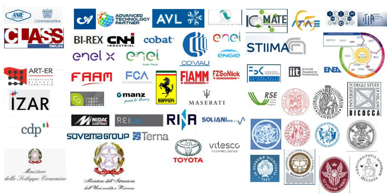
Figura 2: Composizione del gruppo nazionale informale sulle batterie

Il gruppo si pone come piattaforma informativa per trasferire da e verso gli stakeholder italiani – industria e ricerca – informazioni e input sulle novità in discussione a livello europeo, con un focus su ricerca industriale e/o caratterizzata da TRL medio-alti. Attualmente il gruppo conta 28 imprese e 22 organizzazioni di ricerca 1 , insieme a società di consulenza e associazioni, come rappresentato in Figura2.