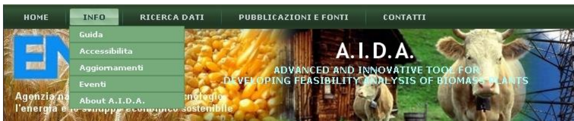
Figura 1. Nuovo header della pagina web con aggiunta nuove sezioni.

Di particolare importanza la creazione di ulteriori sezioni quale "aggiornamenti" all'interno della quale è riportata, in formato tabellare, la sequenza cronologica delle modifiche, delle integrazioni e delle revisioni della piattaforma (Figura 3).