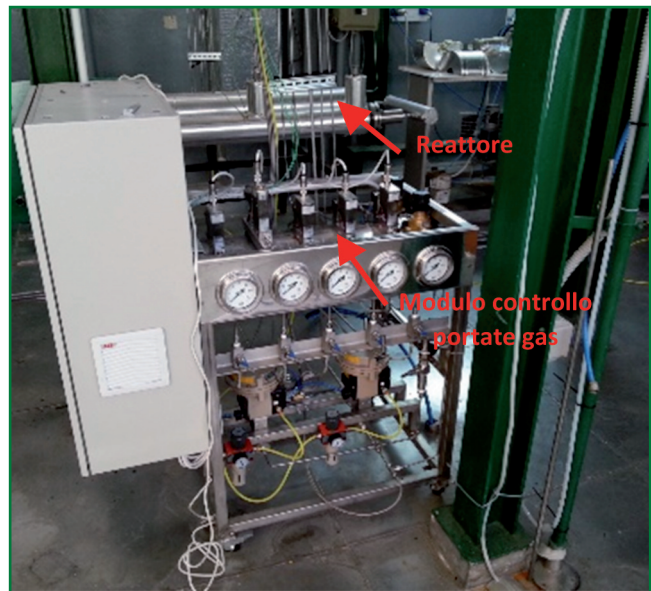
Impianto pilota BioSNG