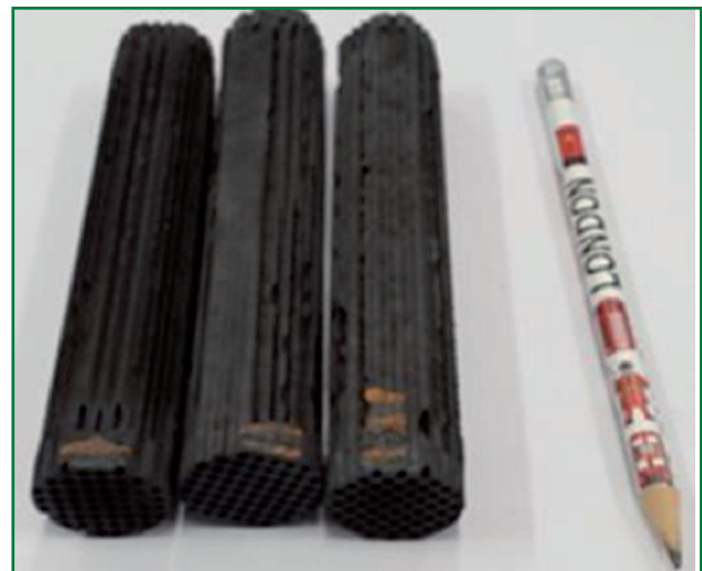
Filtri realizzati per le prove di abbattimento degli inquinanti nei fumi di combustione allo scarico della caldaia a biomassa presso ENEA Saluggia

Area di ricerca: Produzione di energia elettrica e protezione dell'ambiente