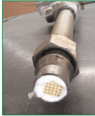
Monolite con V 2 O 5 per l'ossidazione selettiva dell'H 2 S