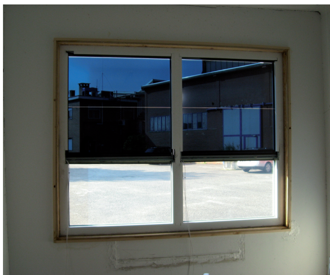
Vetro elettrocromico installato in una cella di prova

Lo studio "Metodologia per l'elaborazione dei dati climatici necessari per la progettazione degli impianti per il riscaldamento degli edifici", prodotto in tale ambito, colma alcune lacune nella normativa tecnica per quanto attiene i dati riguardanti il comportamento termico degli edifici. La finalità è la costruzione "dell'anno tipo" e l'aggiornamento della norma UNI 10349. L'approccio consente di fornire elementi anche per la definizione di zone climatiche estive del territorio italiano. La metodologia sviluppata è stata applicata, quale caso esemplificativo, ai dati climatici aggiornati della regione Lombardia.