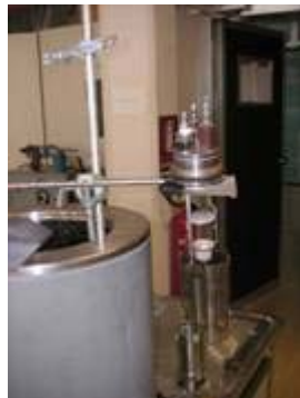
Figura 1: calorimetro di Berthelot Mahler

Il calorimetro è costituito da un vaso esterno cilindrico a doppia parete, nella cui intercapedine viene inserita dell'acqua a temperatura ambiente, che ha lo scopo di ridurre al minimo gli scambi di calore con l'esterno.