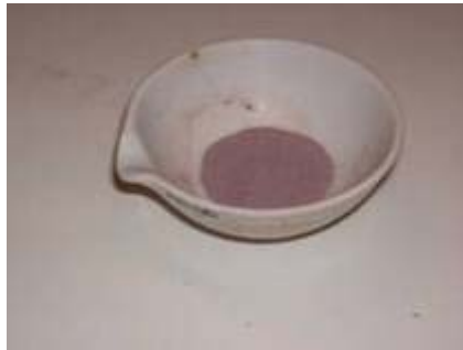
Figura 2: crogiolo contenente le ceneri del campione Sulcis

Il carbonio fisso è un valore calcolato al netto dei valori dell'umidità, delle ceneri e dei volatili.