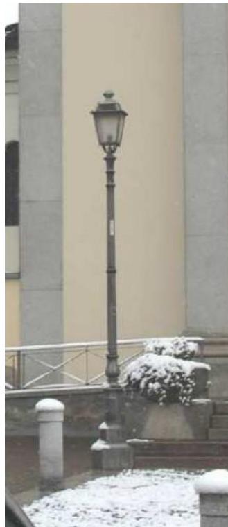
Fig. II.6 Tipologia di palo esistente

Dallo studio della normativa risulta quanto segue (Tab. II.1-2):