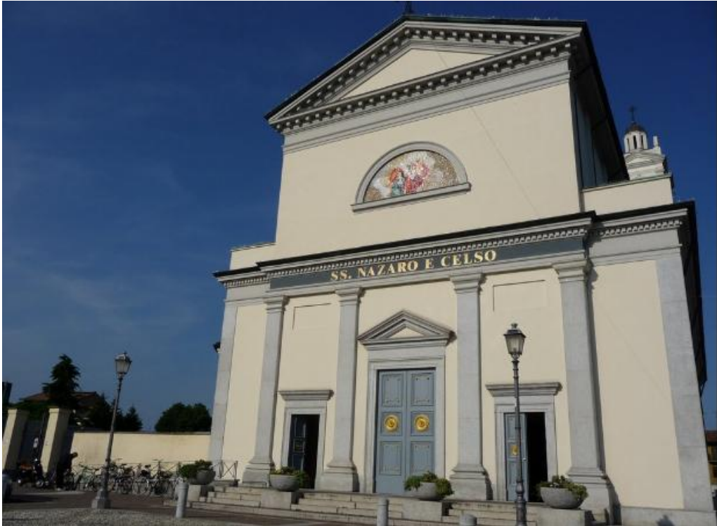
Figura II.1 Facciata della chiesa dei Santi Nazareno e Celso