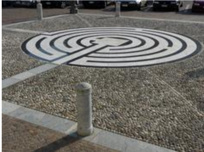
Figura II.3. Vedute dei percorsi che costeggiano la piazza e del labirinto

I margini dell'area possono essere anch'essi posti all'interno di una categoria specifica: