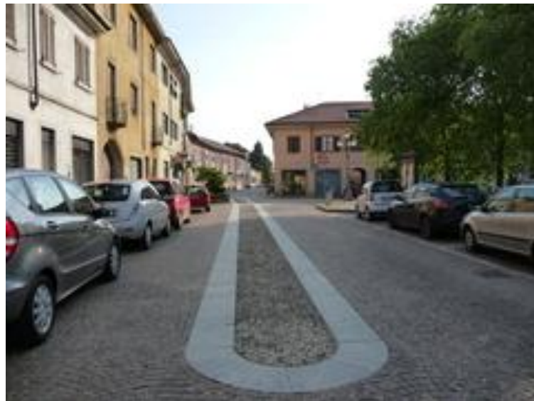
Fig. II.4 Veduta del viale – margine come passaggio

Nella classificazione dei quartieri, Piazza Italia si può definire come il nucleo di un quartiere poiché costituisce un'entità storicamente affermata.