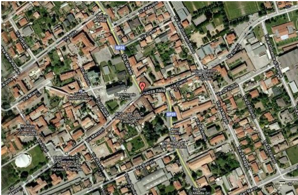
Figura I.2. Individuazione di Piazza Italia sulla planimetria satellitare del Comune di Marcallo