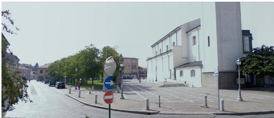
Figura I.3. immagine dello stato attuale di Piazza Italia

Per quanto riguarda i materiali costituenti questo vuoto urbano, il manto stradale dell'area è realizzato in porfido, mentre la chiesa parrocchiale è in pietra bianca. Ulteriore elemento notevole ai fini progettuali è la presenza di due telecamere di sorveglianza, di cui tener conto al momento della disposizione delle sorgenti.