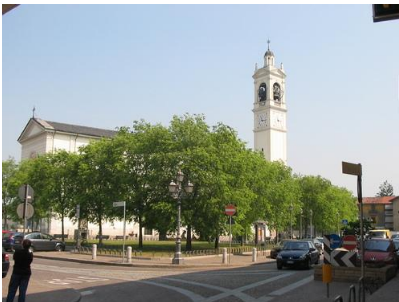
Figura II.2. Vedute dei percorsi che costeggiano la piazza e del labirinto