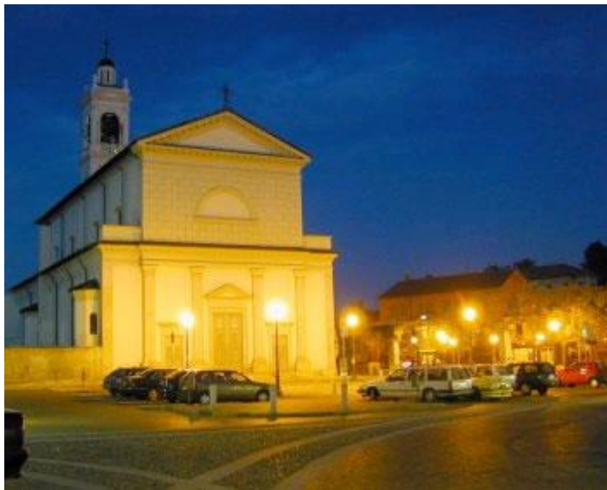
Figura II.7. Visione notturna di Piazza Italia: risulta evidente l'illuminazione eccessiva in alcuni punti e carente in altri con una resa cromatica scadente

Allo scopo di realizzare un impianto di illuminazione adatto a tutte le condizioni luminose, risulta auspicabile uno studio delle variazioni ed i mutamenti della piazza durante le ore diurne. Lo scopo finale dell'operazione è il mantenimento del rapporto esistente tra i singoli monumenti presenti nell'area ed il contesto in cui sono inseriti.