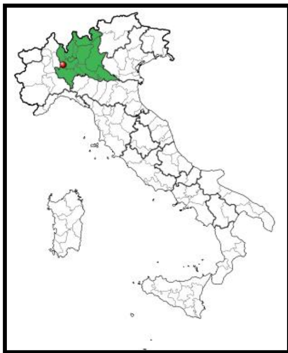
Figura I.1 Inquadramento del comune di Marcallo sul territorio italiano

Durante il corso dell'anno, piazza Italia è teatro di diverse manifestazioni, tra cui il mercato settimanale del venerdì, la fiera di San Marco il 25 aprile e le festività natalizie, con installazione di luminarie dall'8 dicembre al 6 gennaio.