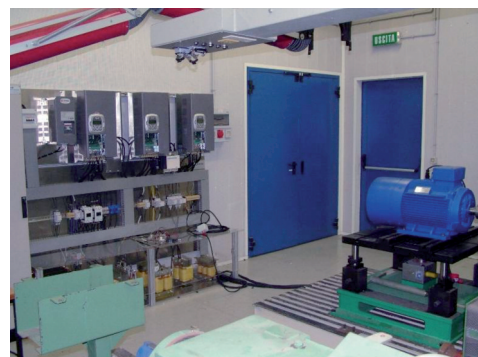
Vista di insieme del prototipo costruito presso l'ENEA

Nell'ambito delle applicazioni di sistemi di accumulo elettrico, importanti attività sperimentali si sono svolte presso i laboratori ENEA del Centro Ricerche ENEA Casaccia. Una prima sperimentazione ha riguardato i sistemi di accumulo; sono anche state eseguite prove di sistema "hardware emulated", dove componenti e sottosistemi sono in maggioranza reali.